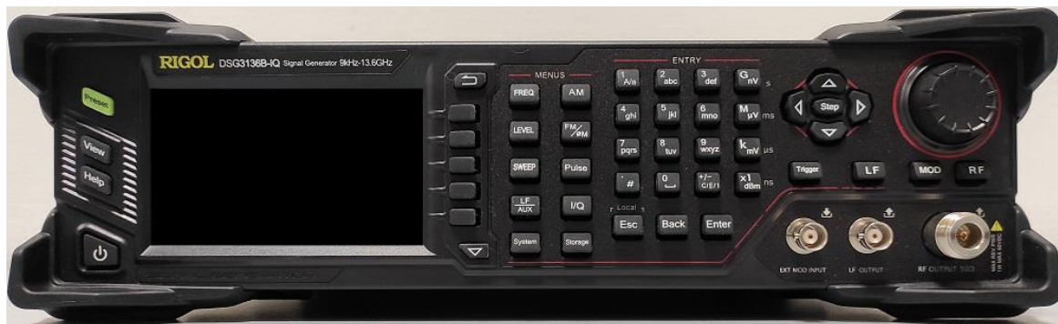
Рисунок 1 – Передняя панель генераторов DSG3000B